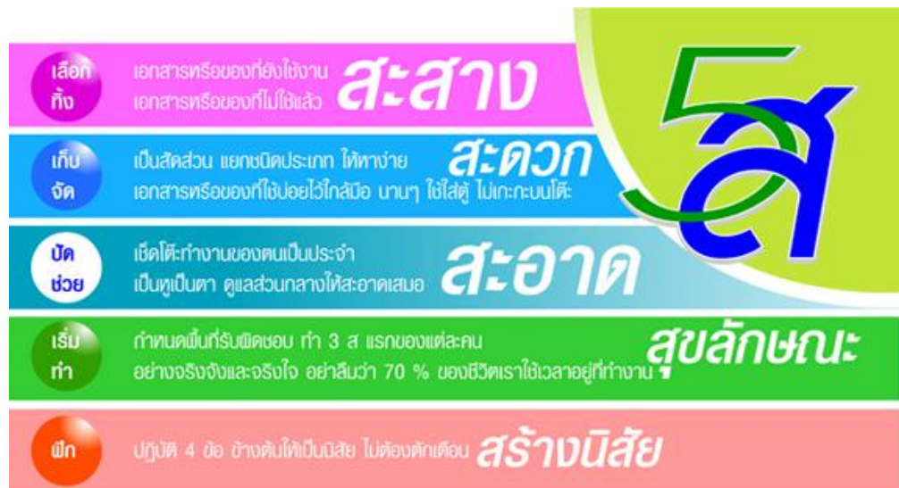
กระบวนการ ๕ ส ของ สำนักงานเกษตรอำเภอนิคมพัฒนา

สำนักงานเกษตรอำเภอนิคมพัฒนา จังหวัดระยอง ได้มีการขับเคลื่อนการดำเนินงานเกษตรอำเภอ Smart Office ตามนโยบายของกรมส่งเสริมการเกษตร โดยมีการจัดประชุมเจ้าหน้าที่เพื่อรับทราบนโยบาย และร่วมกันแสดงความคิดเห็นเพื่อกำหนดเป็นแผนการดำเนินงานประจำเดือน โดยเริ่มจากการใช้กระบวนการ ๕ ส ในการปรับปรุง และพัฒนาสำนักงานให้น่าอยู่ มีความเป็นระเบียบเรียบร้อย เพื่อสนับสนุนกระบวนการทำงานให้แก่ เจ้าหน้าที่ และเกษตรกรที่เข้ามาใช้บริการ